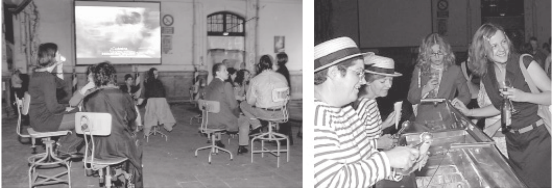
Manifesta Jaia. Tabacalera 2004.