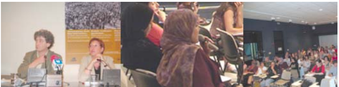
Arabiar irudikapen garaikideak. Eyal Sivan Artelekun.

Proiektu hau lankidetzaren sare zabalago baten barnean sartzen da, eta sare honek hausnarketa jarraitu eta etengabea ahalbidetzen du, nazioarteko lankidetzaren sare zabalean parte hartzen duten eragile guztia sartutako partaidetza prozesuaren bidez. Era berean, ekoizlearekin akordio bat lortu dugu filma editatzeko eta mintegiko partaideen ponentziak eta bertaratuen interbentzioak jasoko dituen argitalpenari eransteko. Material hau guztia eskura dago gure web orrian, eta zuzenean eskaini zen, bere garaian, Internet bidez.